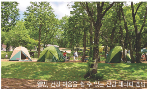
웰빙, 건강 마음을 실 수 있는 산림 테라피 캠핑