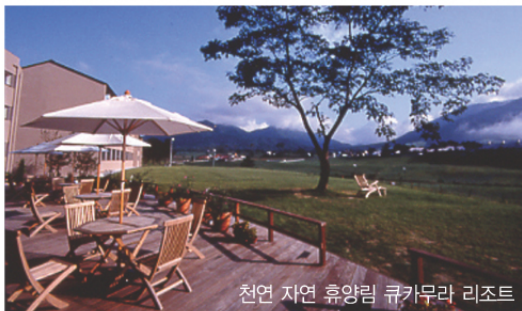
천연 자연 휴양림 큐카무라 리조트